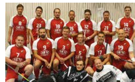
AIF:s innebandylag.

Adelsö IF Innebandy har när detta skrivs precis gått igång med sin åttonde säsong i seriespel. Denna säsong spelar man i division 5 västra Stockholm. Genom alla år så har laget haft en tunn trupp och tvingats spela de flesta matcherna med för få spelare. Till denna säsong har truppen blivit större och tillskotten, som kommer från Ekerö IK B, är alla duktiga spelare. Det har gjort att vi fått helt andra förutsättningar än tidigare och det har vi utnyttjat till att sätta en spelidé som spelarna köpt. Hittills har det varit en stor framgång. Från att ha varit det lag som alltid släppt in särklassigt flest mål är vi nu ett av de lag som släppt in