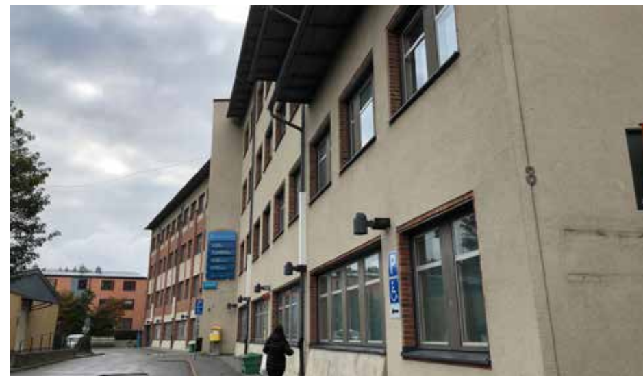
Ekerö vårdcentral.

Väntetider varierar inom olika områden. Garantin som finns är att du ska komma i kontakt med din husläkarmottagning samma vardag, att du ska kunna få en medicinsk bedömning hos någon där inom tre dagar. För vård hos andra specialister gäller att vård för första besök ska ske inom en månad och första behandling