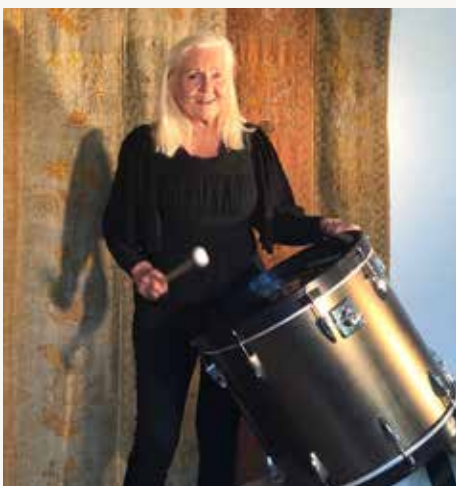
Från pjäsen "Kap farväl" 2019