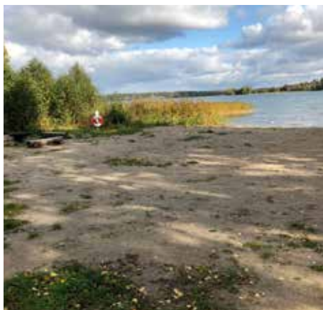
Stranden ser välkomnande ut. Men botten är vass och ogästvänligt.

I brevet skriver Värna Adelsö att kommunen bör se till att man lägger dit sand i tillräcklig mängd och på ett professionellt sätt med dukar etc. En tanke är att man också bygger en liten brygga så att det blir lättare att ta sig i vattnet. Det bör också ordnas ett avsnitt på stranden som är anpassat för mindre barn med extra mycket sand. Det måste vara möjligt att bada vid kommunens badplats på Adelsö, säger Värna Adelsö.