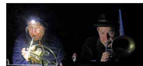
Adelsö Blåsare.