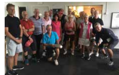
Deltagarna i Adelsögolfen 2019.