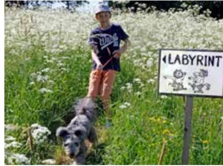
Smedjans nya labyrint lockade till mycket spring.