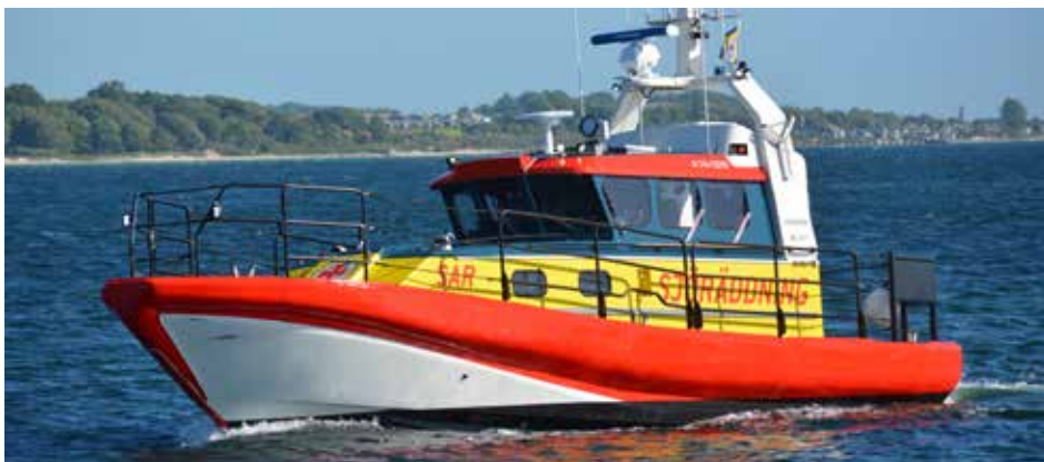
En av Sjöreddningens båtar.