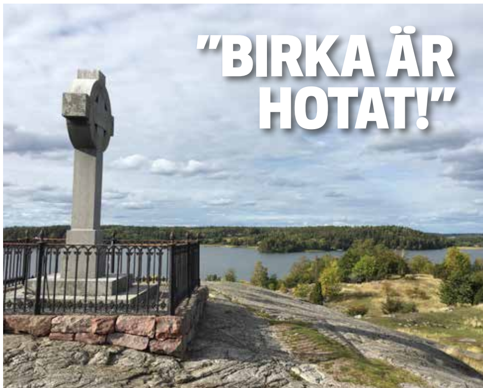
Borg med Ansgarsmonumentet. Borg var Birkas försvaransläggning.