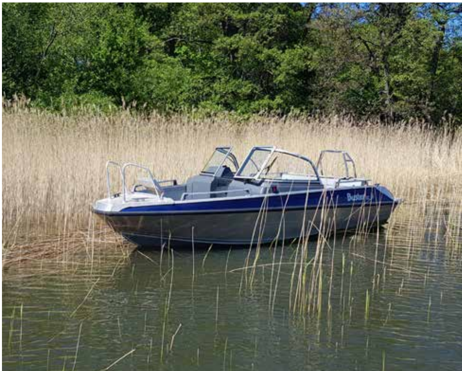
Roy's båt hittades i vassen vid Stenby. Utan motor och utrustning.