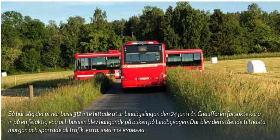
Så här såg det ut när buss 312 inte hittade ut ur Lindbyslingan den 24 juni i år. Chauffören försökte köra in på en felaktig väg och bussen blev hängande på buken på Lindbyvägen. Där blev den stående till nästa morgon och spärrade all trafik.