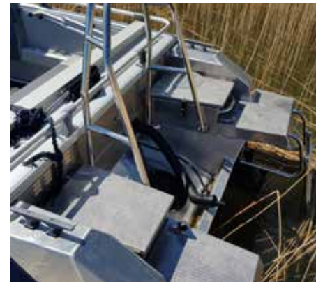
Motorn var bortspliten.

Det finns en arbetsgrupp som har regeringens uppdrag att komma med förslag som kan begränsa utförseln av stöldgods. Den