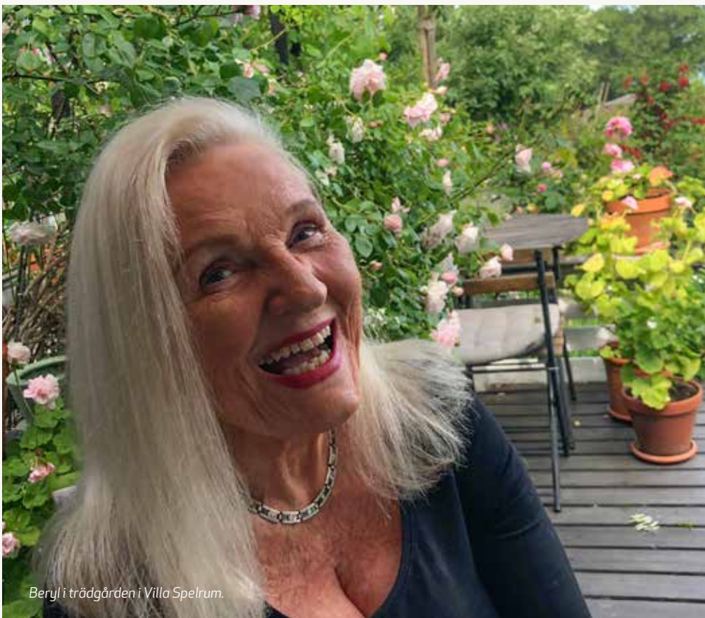
Beryl i trädgården i Villa Spelrum.