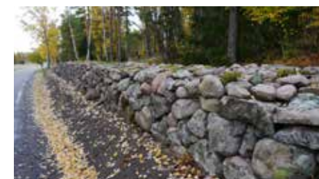
Även vid Stora Dalby har Trafikverket restaurerat en kort mur längs Ringvägen.