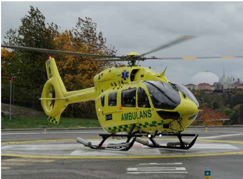
Helikopter som går ner för tankning på Södersjukhuset.