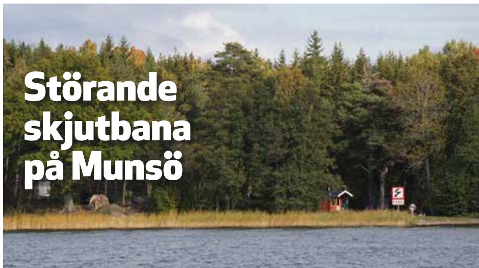
Skjutbanan ligger invid det gamla Hässlesandsbadet i närheten av Sjöängen.