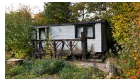
Den gamla informationsbyrån börjar också likna en ruin.

■ Kommer man in på Hovgårdsområdet finns det inga pilar som anger vart man ska gå. Ej heller information om vad man kan se (i själva verket ska man passera en hage till innan man kommer till – ja det vet man inte).