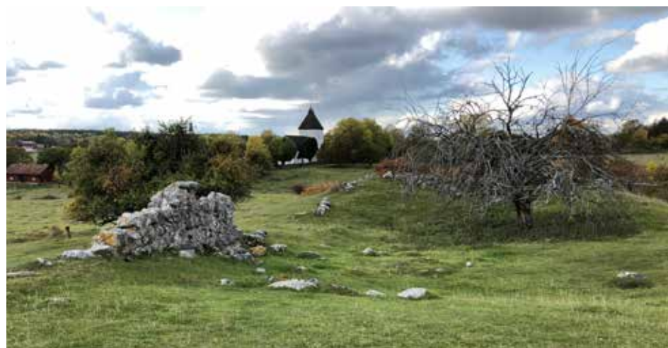
Ruinen av Alsnö hus. Byggs av kungarna Valdemar Birgersson och Magnus Ladulås på 1200-talet. Hovgården är ett Världsarv.