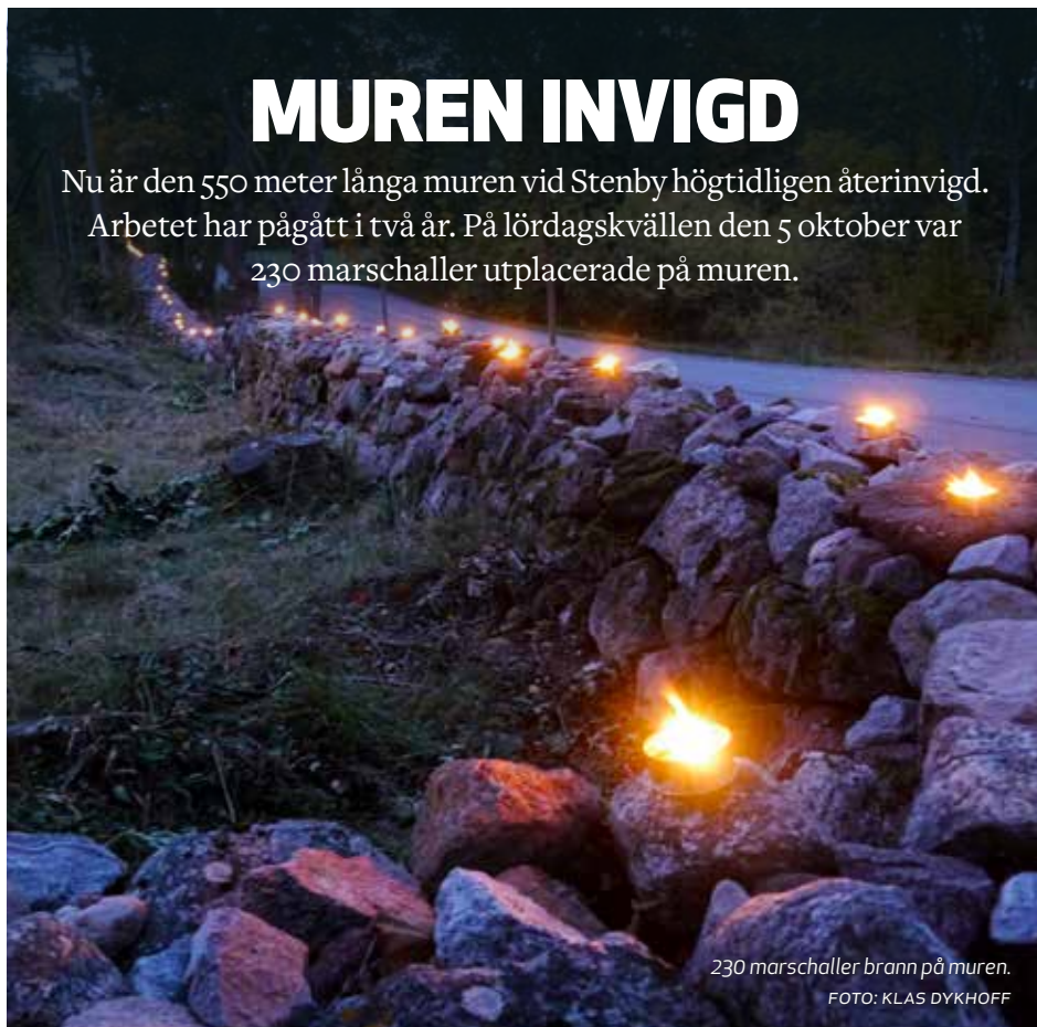
230 marschaller brann på muren.

Nu är den 550 meter långa muren vid Stenby högtidligen återinvigd. Arbetet har pågått i två år. På lördagskvällen den 5 oktober var 230 marschaller utplacerade på muren.