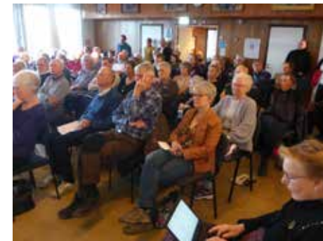
Det var mycket folk på informationsmötet i våras när kyrkan redogjorde för sina planer på att privatisera Hembygdsgården.

KYRKAN RUSTADE INTE UPP HEMBYGDSGÅRDEN TROTS ATT DET FANNS PENGAR BUDGETERADE