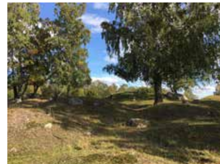
Hemlanden är Birkas stora gravfält. Här finns 1 600 gravar synliga ovan jord.