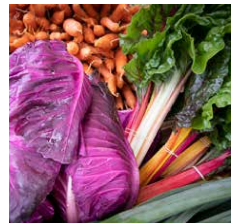
Röd spetskål fångar ögat när Noble Farming dukar upp till försäljning på Hembygdsdagen.