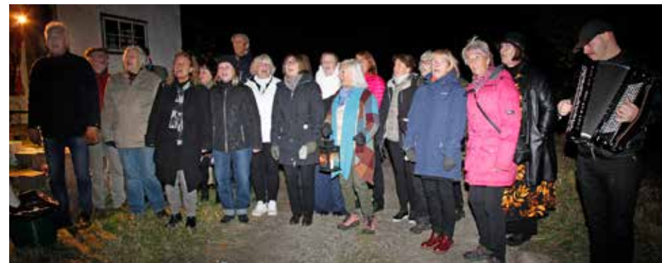
Vällingby Sång och Visa.