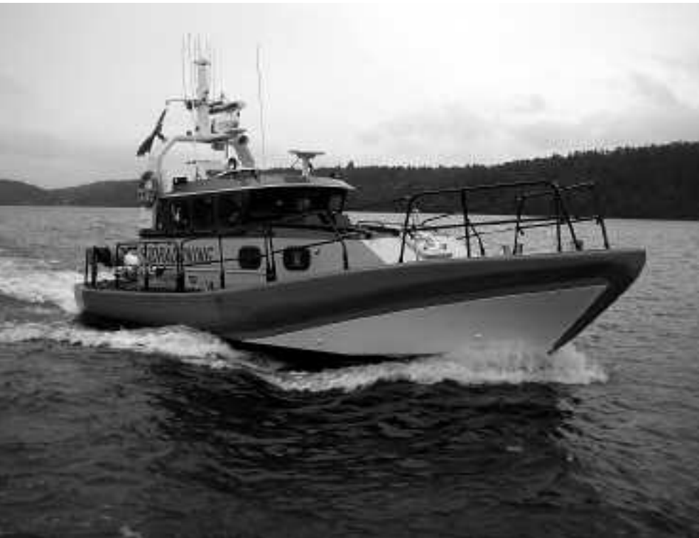
Sjöräddningsfartyget Amalia Wallenberg kan köra i 34 knop.