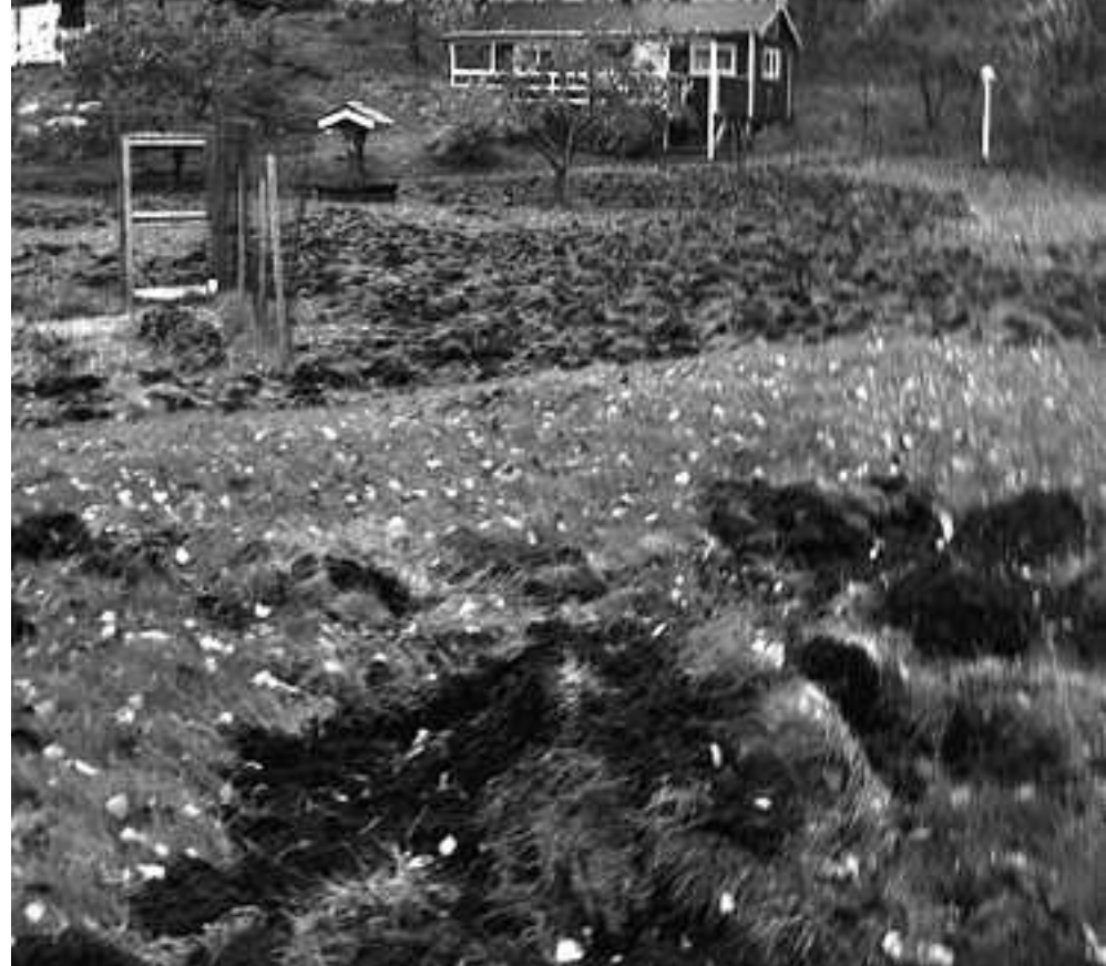
Så här ser ut på många tomter på Adelsö efter höstens härjningar.

– Jag förstår frustrationen och upprördhet när vildsvinen har varit inne på tomten och bökat, men det jag har svårt att förstå är om man blir förvånad att det upprepas och att man inte själv försöker stänga ute dem. På sommaren sover man ju inte med öppet fönster utan myggnät om det är så att man har problem med mygg, säger han. Vildsvinen har ju åter kommit till ön för cirka 10 år sedan och oavsett vad man anser om dem så kommer de att finnas kvar.