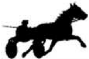
Travlegenden Big Noon är numera en del av Menhammars logotyp.

och samverkar med Alfa Laval för att utveckla en reningsteknik för fartygsvatten utan kemiska substanser,