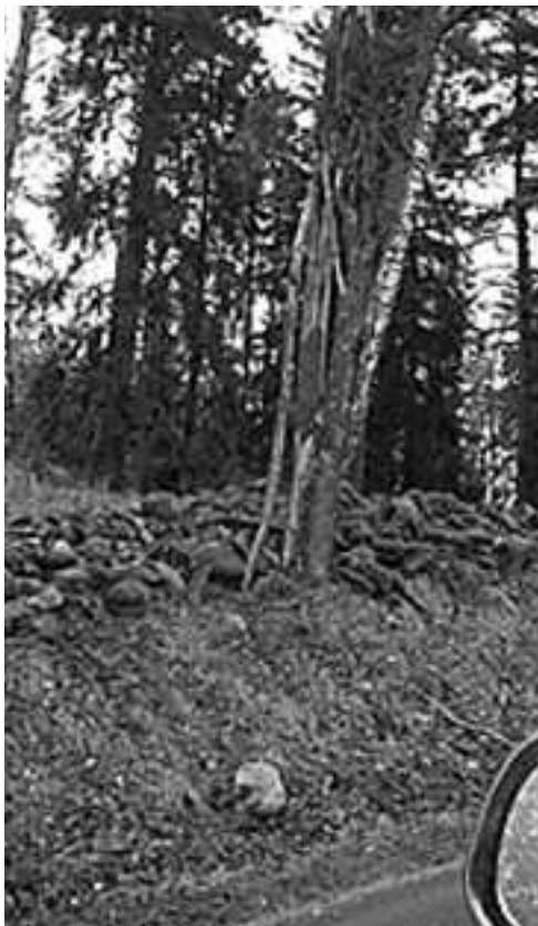
Flertalet av dessa ruttna träd vid Stenby har nu fällt av Trafikverket efter påstötningar från Värna Adelsö.

Christer Svanberg larmade i vintras om risken för att ruttna träd skulle komma att knäckas vid kraftig vind utmed Ringledden mellan Stenby Gård och Adelsögården. Värna Adelsö tog snabb kontakt med Trafikverket för att få väghållaren att rycka ut och ta bort de träd som var i farozonen.