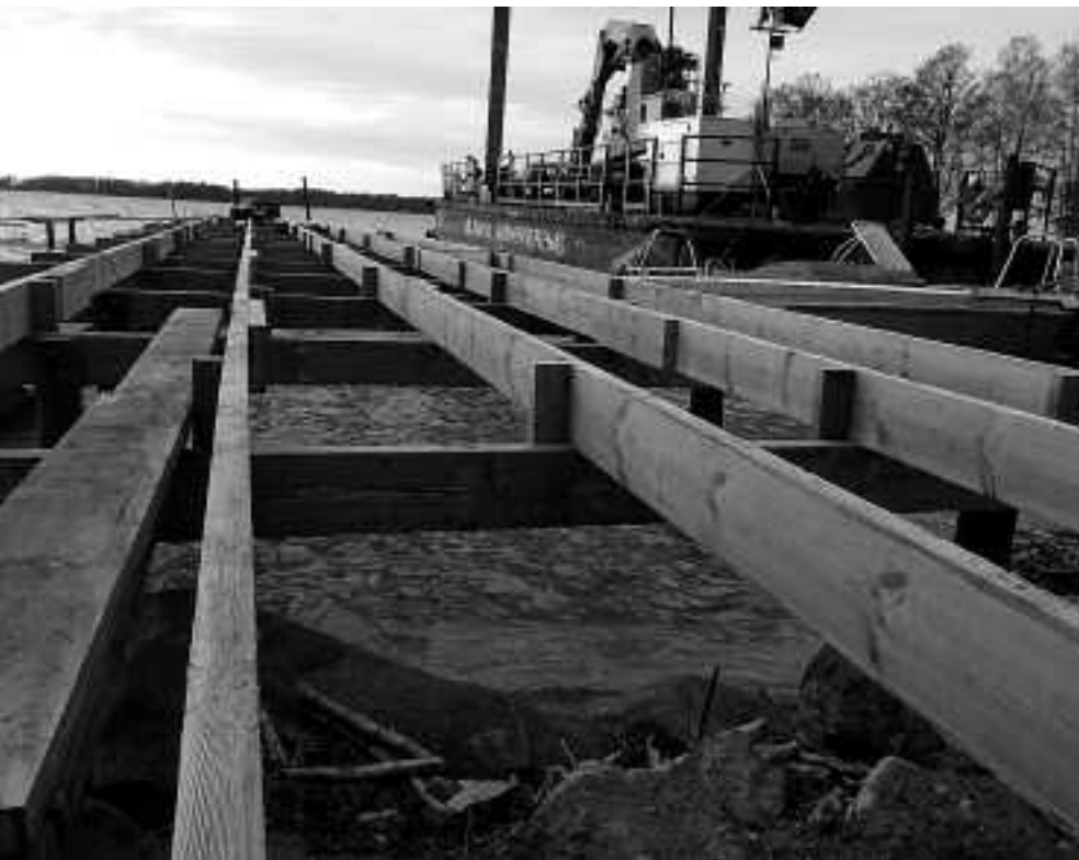
Den nya stora bryggan vid Lissbovik ska vara klar före jul.