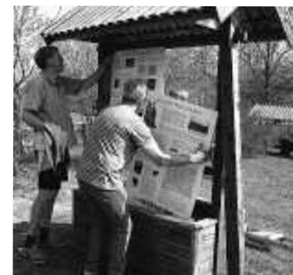
Gröna ön har fixat fyra skyltar om Adelsös historia, att läsa på i Café Hovgårdens trädgård.

Den 1 juni är det dubbelinvigning i Café Hovgårdens trädgård. Då kunde