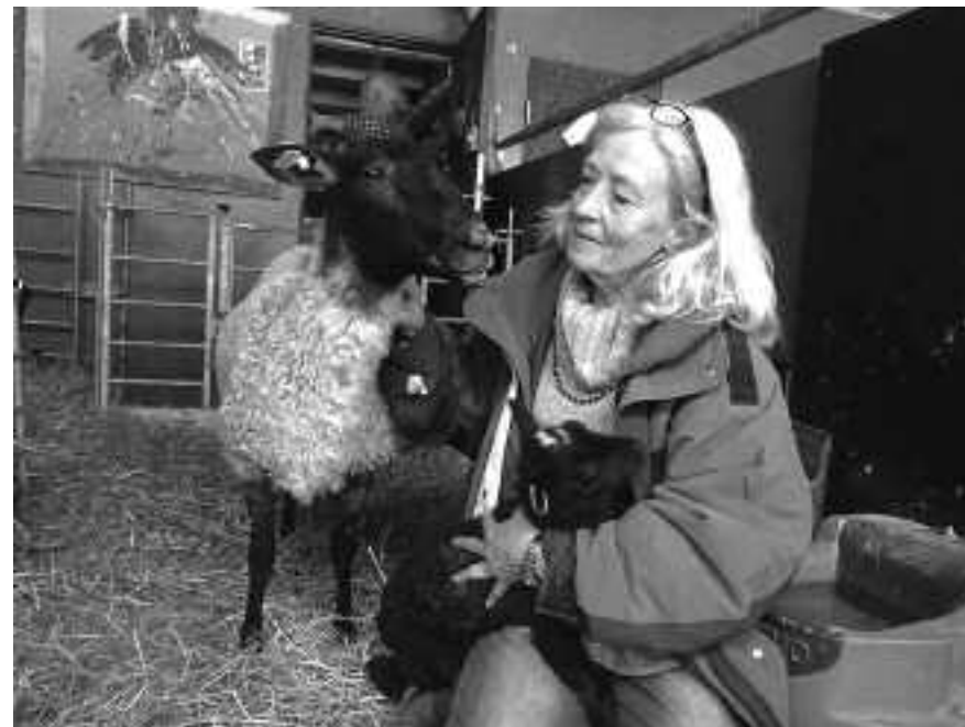
– Det ger sådan energi av att hålla på med djuren. Och de betande djuren hjälper till att hålla landskapet öppet.