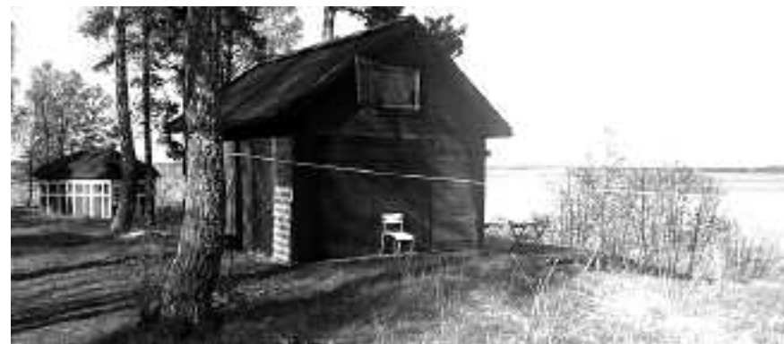
Det tidigare garaget och förrådet har fått bostadsinredning och en altan mot vattnet.