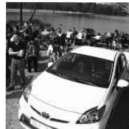
Under vandringsdagen kunde trötta vandrare bli skjutsade från Sättra till Norrängen med två fabriksnya Prius laddhybrid-bilar.

skyltarna presenteras officiellt, samtidigt med kommunens invigning av Vikingabiblioteket.