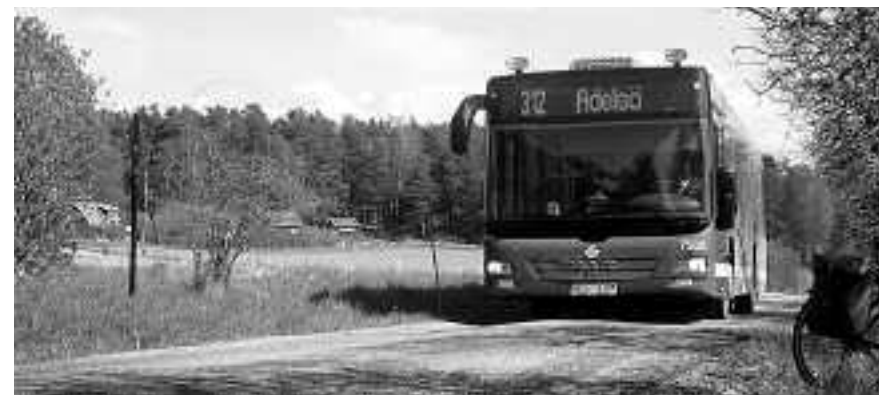
Ny buss på Adelsö, men fortsatt risk för iskalla vinterbussar och blöta säten mellan Sjöängen och stan. Kommunen och Arriva skyller på chaufförerna.