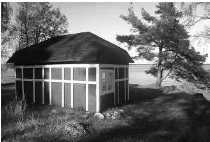
Det tidigare förrådshuset med en väntbänk för ångbåtspassagerare har fått el, vatten, fönster och golv.