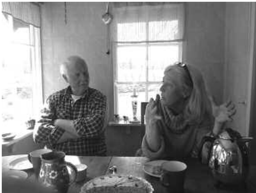
– Det är inte främst för att tjäna pengar som vi håller på med våra projekt. Vi vill göra Adelsö finare.